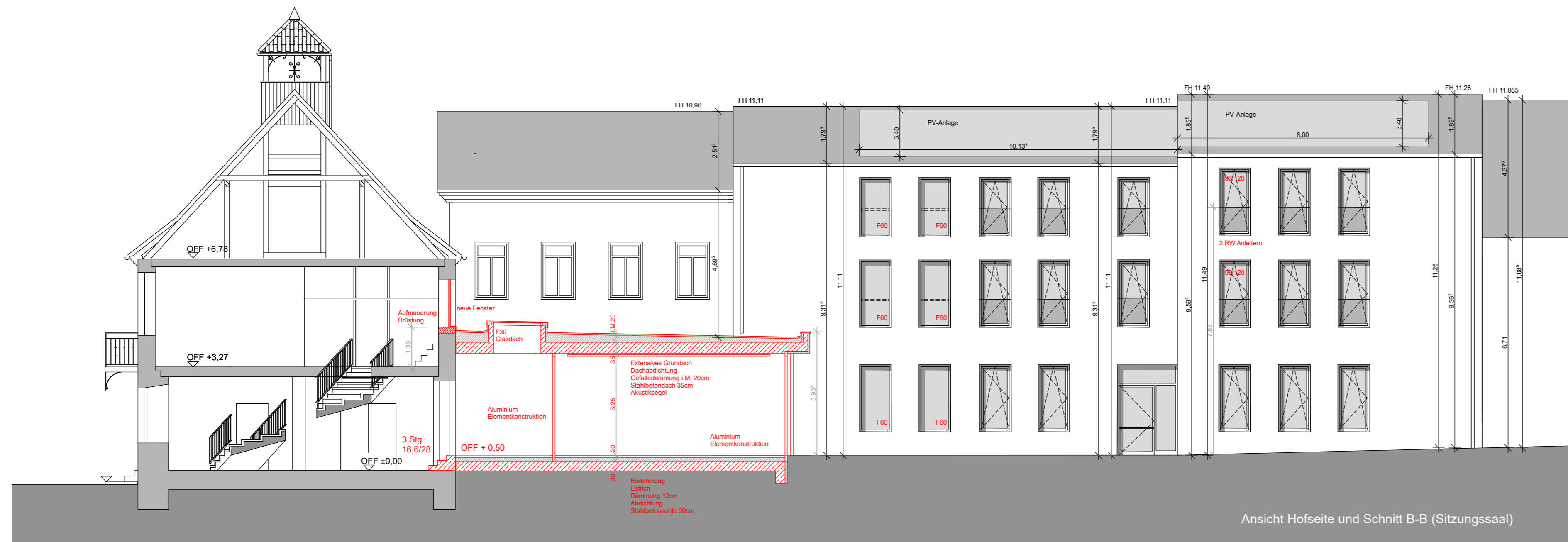
Ansicht Hofseite und Schnitt B-B (Sitzungssaal)